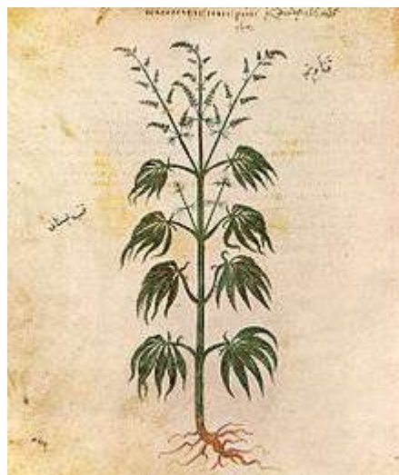
Vienna Descurides: voorstelling uit 512 AC

restanten van zaden en bladeren gevonden naast gemummificeerde priesters in China en Egyptische mummies.